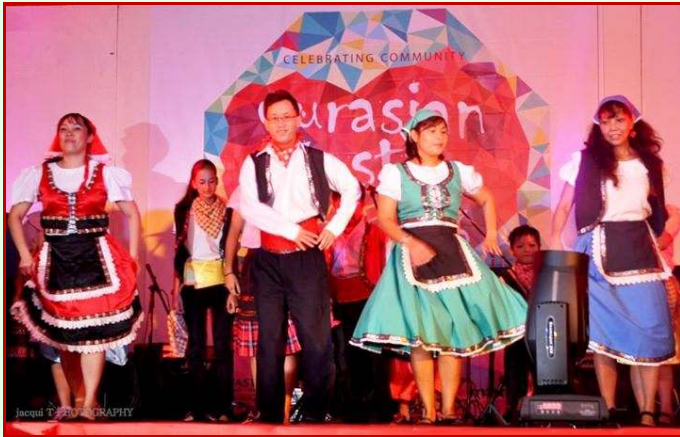
Portuguese dance during the Eurasian Fiesta.

This festival provides a podium in promoting the best of Penang in arts, heritage, historical preservation, eco-