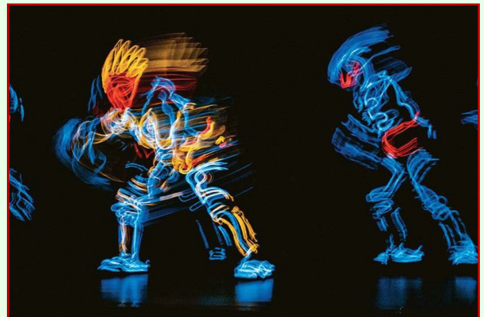
'Circus Circus'

Circus Circusfederal authorities, corporations, associations, and individuals to present the best Penang can offer to the world. The features events revitalize Penang's tourism and service industry by promoting arts and heritage in Penang, through joint efforts and support from Penang State Government, Municipal Council of