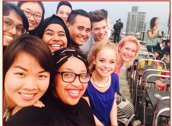
Nederlandse studenten met hun Maleisische buddy's op het Heli platform.

Na de gesprekken met de jongeren in de andere kamers